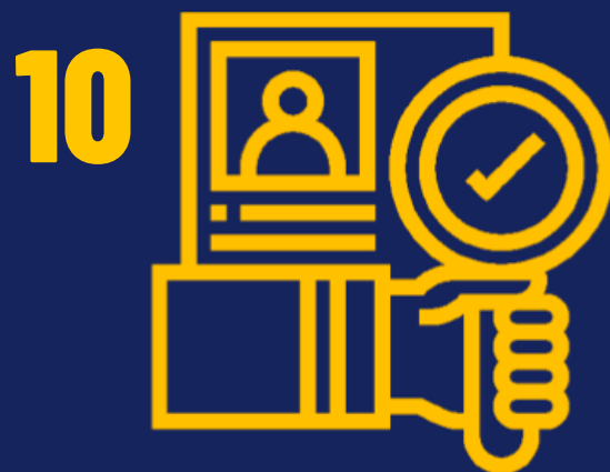
CAMPAÑAS DE CEDULACIÓN