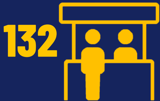
OPERATIVOS EVENTOS PÚBLICOS