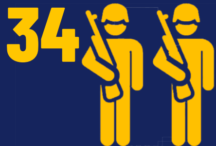
OPERATIVOS CAMEX F.F.A.A.