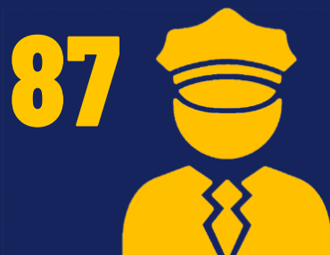
OPERATIVOS ANTIDELINCUENCIAS POLICÍA NACIONAL